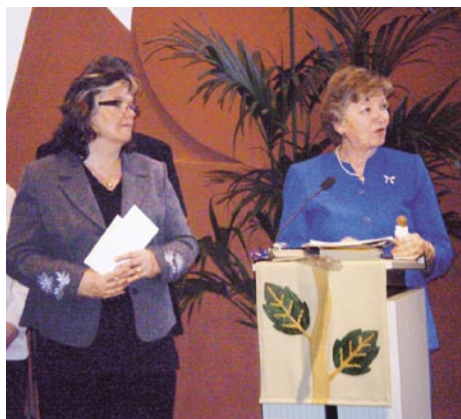
Text och foto: Sheila Liljeberg-Elgert