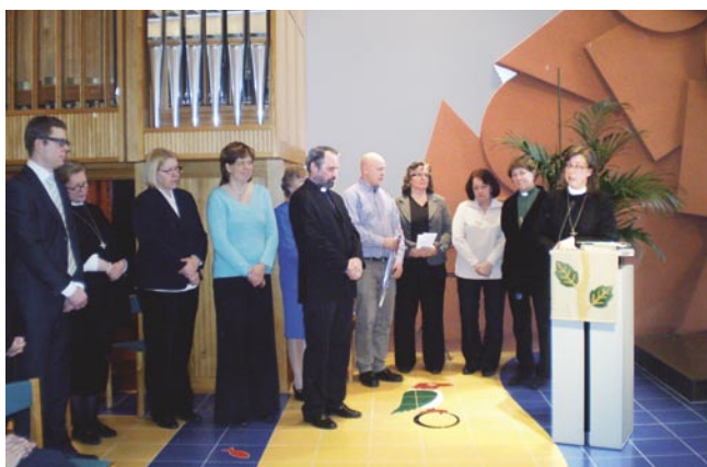
Arbetskamrater och förtroendevalda tackade för gott samarbete och önskade lycka till i de nya uppgifterna.